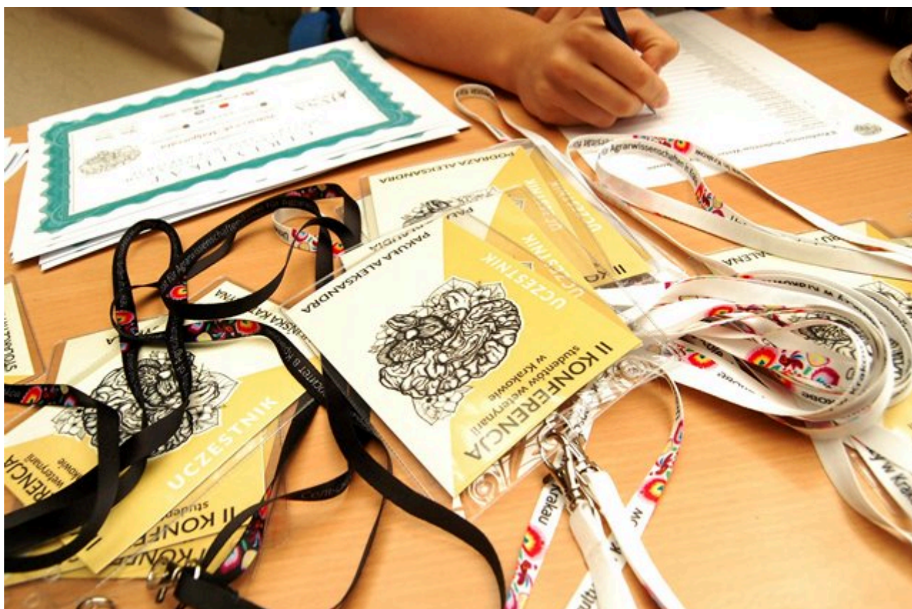
Ubiegłoroczna edycja konferencji

Jak co roku postanowiliśmy zrobić rozeznanie wśród krakowskich studentów w formie ankiety i wybrać tematy na podstawie ich opinii. Tym razem studenci postanowili rozszerzyć swoją wiedzę w wyżej wspomnianych dziedzinach.