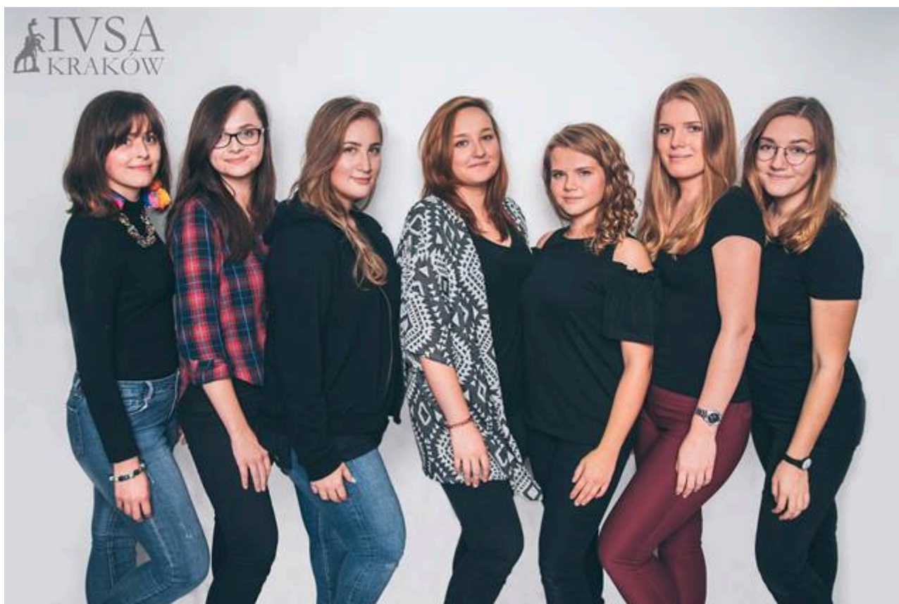
Zarząd IVSA Kraków

Podczas planowania tegorocznej edycji postanowiliśmy zwrócić uwagę na to, jak istotna jest ochrona środowiska oraz ekologiczne wykorzystanie surowców. Z tego też względu m.in. zamiast tradycyjnych plastikowych identyfikatorów uczestnicy nosić będą na rękach opaski identyfikacyjne z „nierozrywalnego papieru”, podczas przerw kawowych wykorzystamy naczynia z trzciny cukrowej, certyfikaty za uczestnictwo w konferencji przesłane zostaną osobom obecnym w formie elektronicznej. Materiały promocyjne oraz konspekty rozdane zostaną w materiałowych plecakach wielokrotnego użytku.