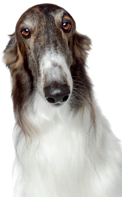
Nazwa: Chart rosyjski (borzoi)