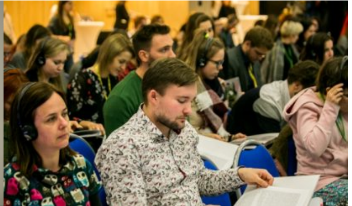
Tłumy uczestników na sali