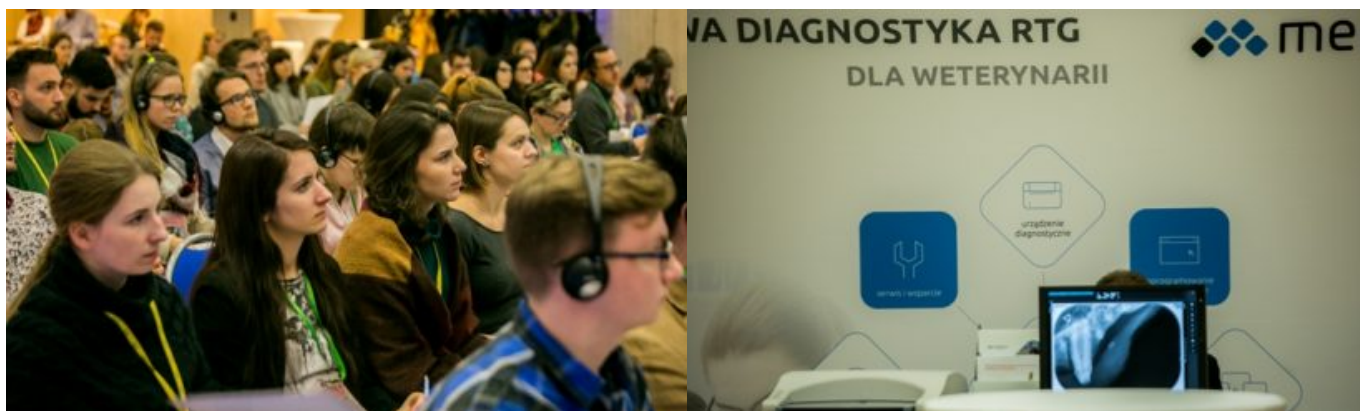
Stoisko jednego ze sponsorów, firmy Medikon