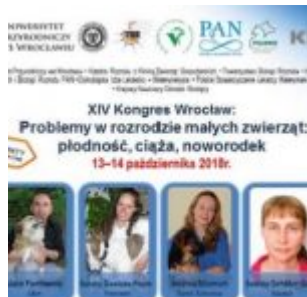
XIV Kongres "Problemy w rozrodzie małych zwierząt-płodność, ciąża, noworodek"