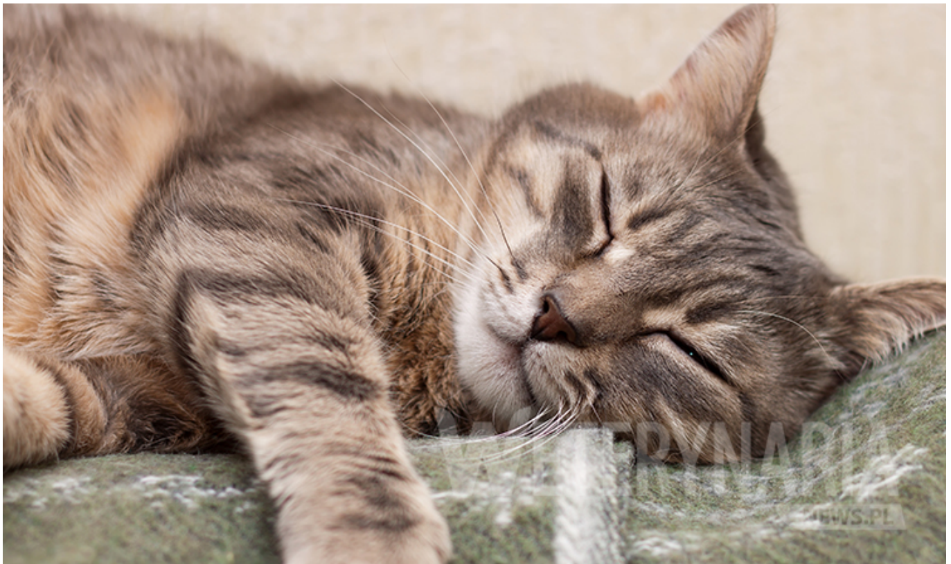
Zdjęcia ilustracyjne / Adobe Stock

Lamblia (giardia) to jednokomórkowy pierwotniak, pasożyt atakujący zwierzęta domowe: psy i koty. Giardioza ma również potencjał zoonotyczny i człowiek również może stać się ofiarą pasożyta wewnętrznego. Dowiedz się, jak Ty lub kot możecie zarazić się lamblią, jak wyglądają objawy giardiozy i poznaj sposoby zapobiegania chorobie pasożytniczej.