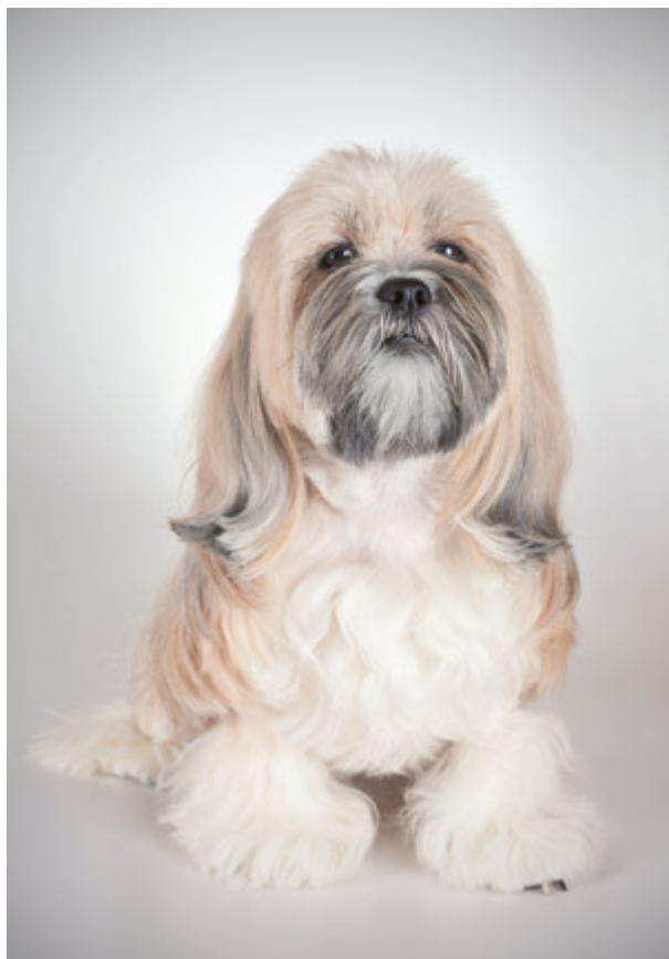
Kraj pochodzenia: Tybet