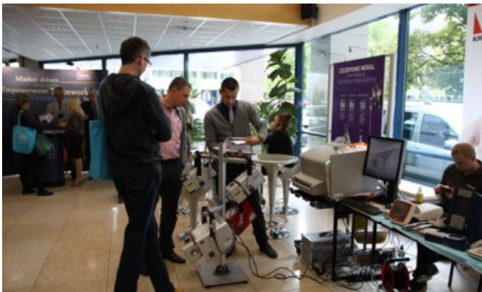
Wiele firm przyjechało do Wrocławia zaprezentować swój sprzęt.

We Wrocławiu odbyła się kolejna, IX edycja Sympozjum Rozrodu Małych Zwierząt. 26 - 28 września 2013 r. Uniwersytet Przyrodniczy odwiedziło 350 osób, aby wziąć udział m.in. w warsztatach i sesji plakatowej oraz wysłuchać znanych specjalistów. Tematyka obejmowała m.in. międzynarodową wysyłkę nasienia, wady wrodzone, cesarskie cięcie czy pediatrię psów i kotów.