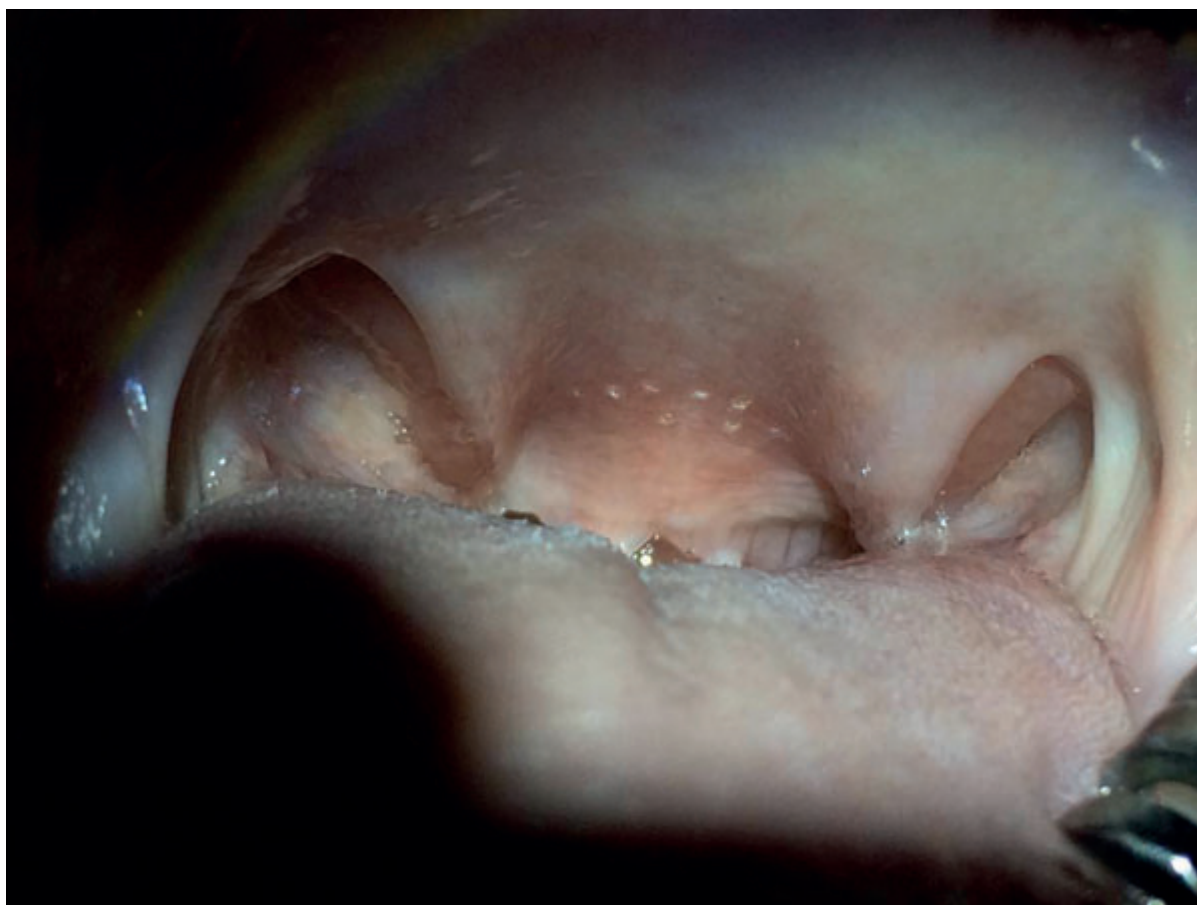
Caption: Fot. 3. Wyznaczenie linii cięcia przedłużonego podniebienia miękkiego pojedynczym impulsem lasera CO2.