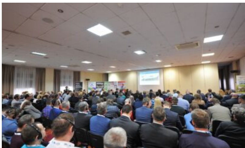
Uczestnicy Kongresu Trzoda 3.0

31 stycznia w Hotelu 500 Tarnowo Podgórne (koło Poznania) odbył się Wschodnioeuropejski Kongres Trzoda 3.0. To już trzecia edycja Kongresu, dawniej występująca pod nazwą Narodowy Dzień Świni. Tym razem wydarzenie zgromadziło przeszło 300 uczestników z całego kraju i z zagranicy, w tym: hodowców i producentów trzody chlewnej, lekarzy weterynarii, techników weterynarii, zootechników, pracowników akademickich, producentów pasz i dodatków paszowych oraz innych graczy z branży.