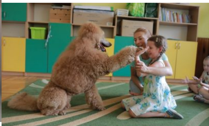
Dogoterapia w szpitalu w Opolu