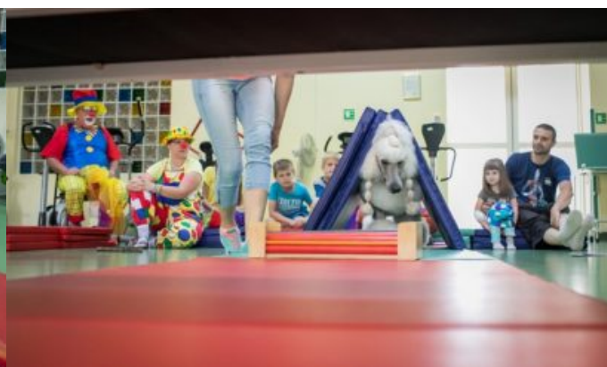
Dogoterapia w szpitalu w Opolu