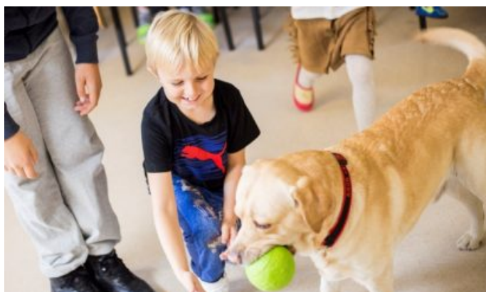
Zdjęcia z zajęć dogoterapii realizowanych przez Mars Polska i Fundację Dr Clown