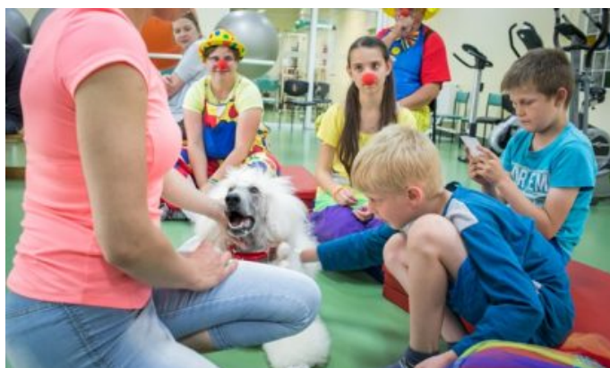
Dogoterapia w szpitalu w Opolu