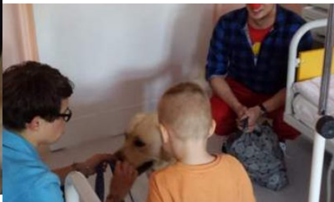
Dogoterapia w szpitalu w Gliwicach