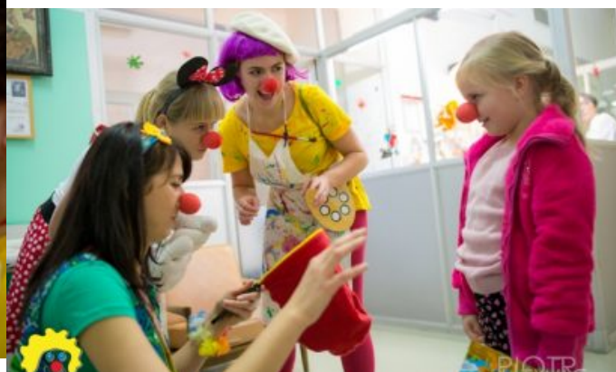
Wolontariusze Fundacji Dr Clown w szpitalu z podopiecznymi