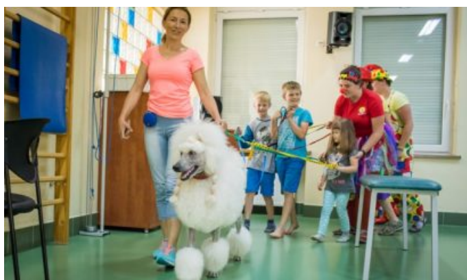
Dogoterapia w szpitalu w Opolu