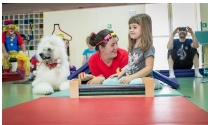
Dogoterapia w szpitalu w Opolu