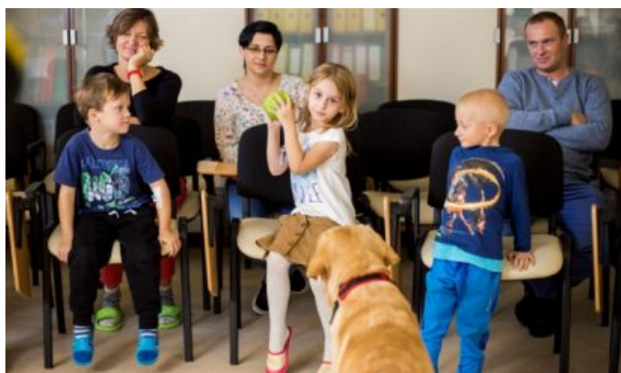
Zdjęcia z zajęć dogoterapii realizowanych przez Mars Polska i Fundację Dr Clown