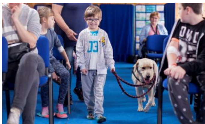
Zdjęcia z zajęć dogoterapii realizowanych przez Mars Polska i Fundację Dr Clown