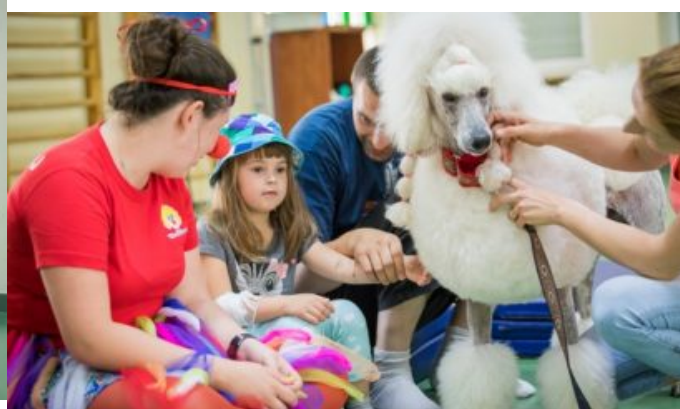
Dogoterapia w szpitalu w Opolu