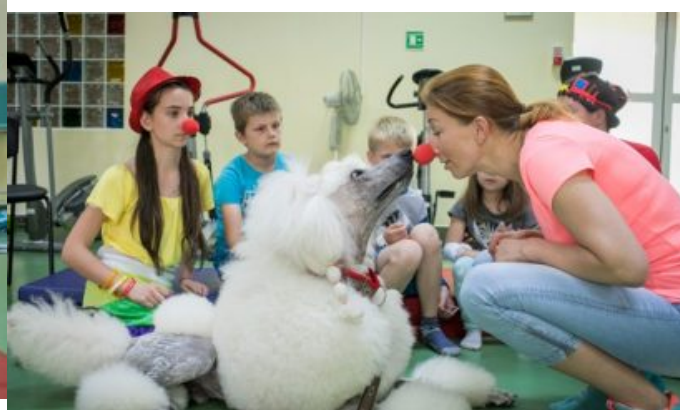
Dogoterapia w szpitalu w Opolu