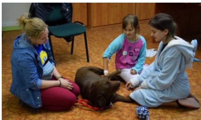
Dogoterapia w szpitalu w Suwałkach