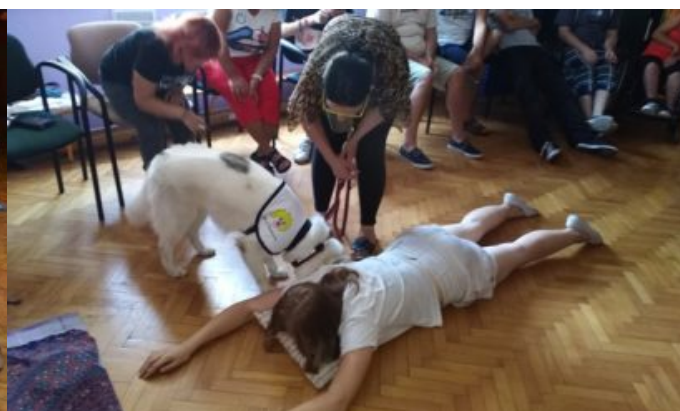
Dogoterapia w szpitalu w Zielonej Górze