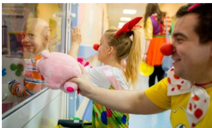
Wolontariusze Fundacji Dr Clown w szpitalu z podopiecznym