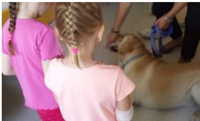
Dogoterapia w szpitalu w Gliwicach

włączonych jest 16 szpitali i ośrodków terapeutycznych w całej Polsce.